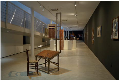
Figura 5. Vista de l'exposició "Trenar".

El trenat és una activitat ben antiga, que es remunta a les primeres societats modernes que treballaren la pell. A Mallorca, els seus orígens no són prou clars, però és probable que estiguin lligats a la indústria del calçat. Rafel Morro i Miquel Sans (2020) no descarten que es treni pell a Mallorca des de l'època medieval, ja que des d'aquest període es coneix la producció de pell adobada. Tanmateix, la pri-