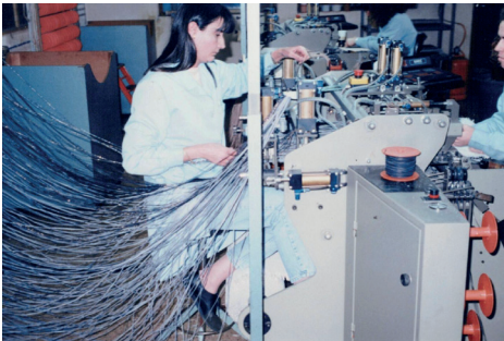
Figura 13. Operàries treballant a la fàbrica de Matrema.