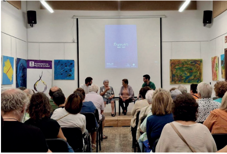
Figura 17. Acte amb trenadores a Maria de la Salut.