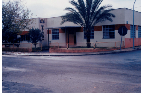
Figura 12. Fàbrica de Matrema.