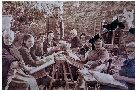
Figura 10. Fotografia publicitària de dones trenant.