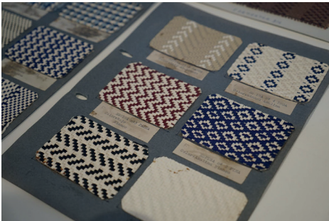
Figura 7. Detalls de l'exposició "Trenar".