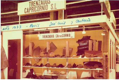
Figura 11. Expositor de Trenzados Capricornio a la Fira del Cuir de París.