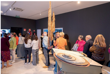
Figura 15. Inauguració de l'exposició “Trenar”.

Finalment, “Trenar” ha assenyalat noves línies de recerca que seran imprescindibles en el futur: aprofundir en el paper de les dones en l'economia submergida del franquisme, estudiar la circulació de tècniques i maquinària entre Mallorca i l'exterior, i analitzar els processos de mecanització i deslocalització que marcaren el declivi del sector. També ha deixat oberta la reflexió sobre les possibilitats de revitalitzar l'ofici, tal com demostren projectes actuals com Mastrenat.