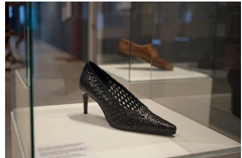
Figura 8. Detalls de l'exposició "Trenar".