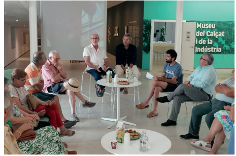
Figura 18. Acte al Museu amb empresaris del trenat.