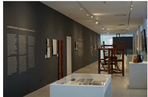
Figura 6. Vista de l'exposició "Trenar".