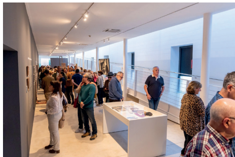
Figura 16. Inauguració de l'exposició “Trenar”.